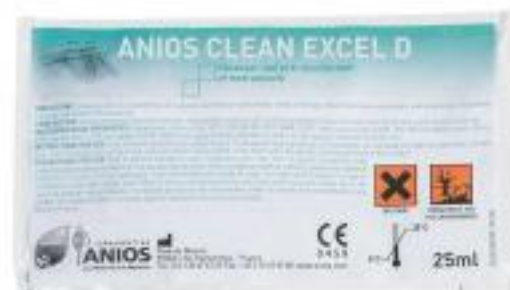
Anios Clean Excel D - 5 doses de 25ml