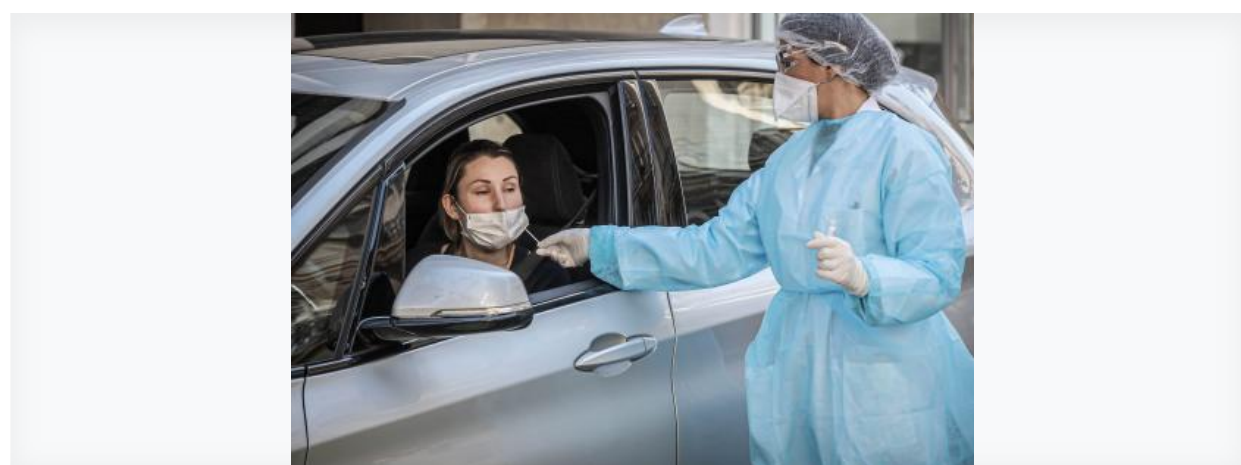
Test Covid 19 d'un professionnel de santé réalisé par un laboratoire à Neuilly sur seine